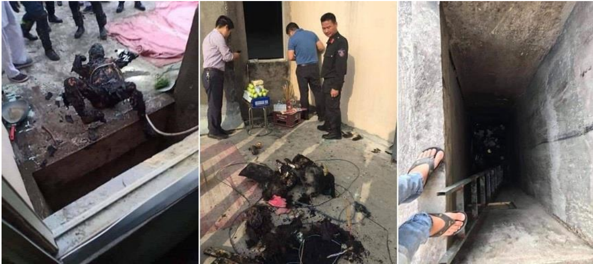
Hình 5 - Thi thể của 3 cảnh sát và hố kỹ thuật.