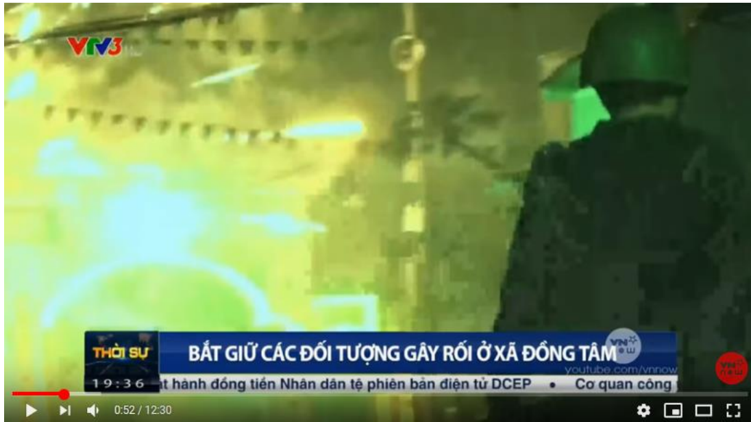
Hình 2 - CSCĐ bị tấn công bằng pháo hoa tại thôn Hoà hng sáng 09/01/2020.