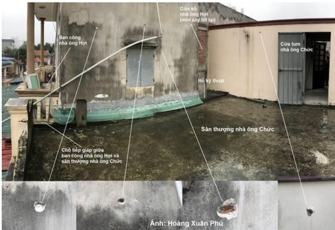
Hình 6 - Khu vực hiện trường.